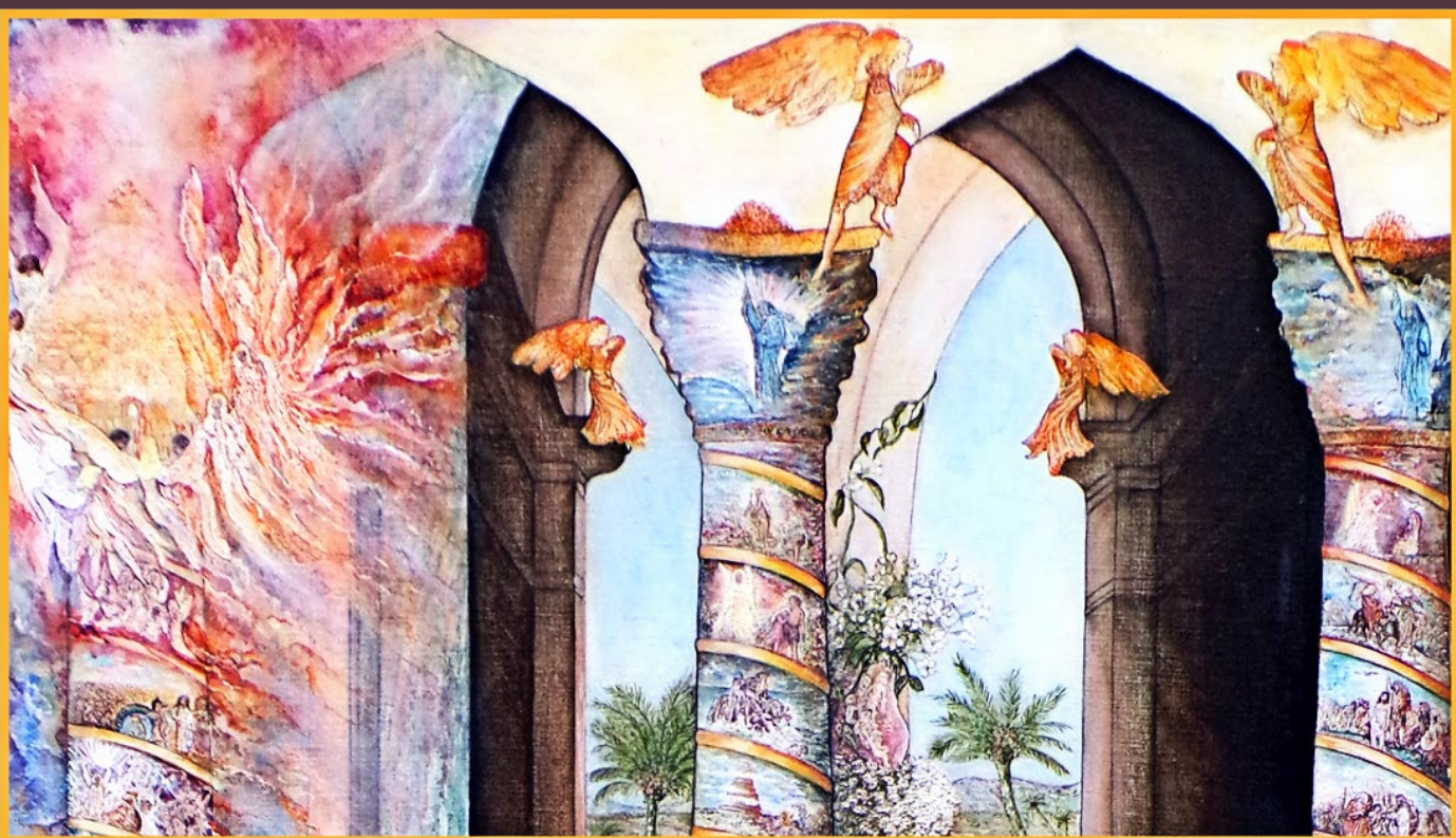
Trois piliers du temple, avec trente-quatre petites peintures