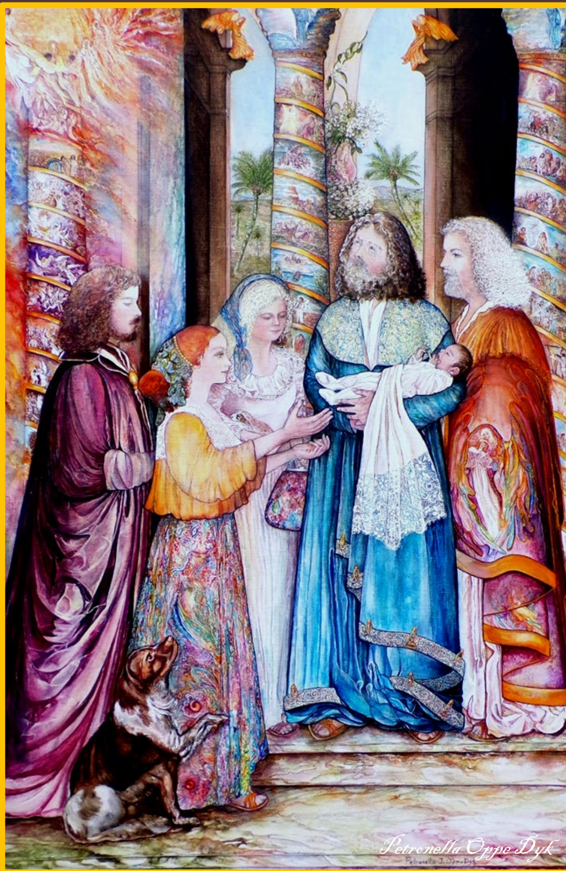
Marie et Joseph ont consacré Jésus au Seigneur®