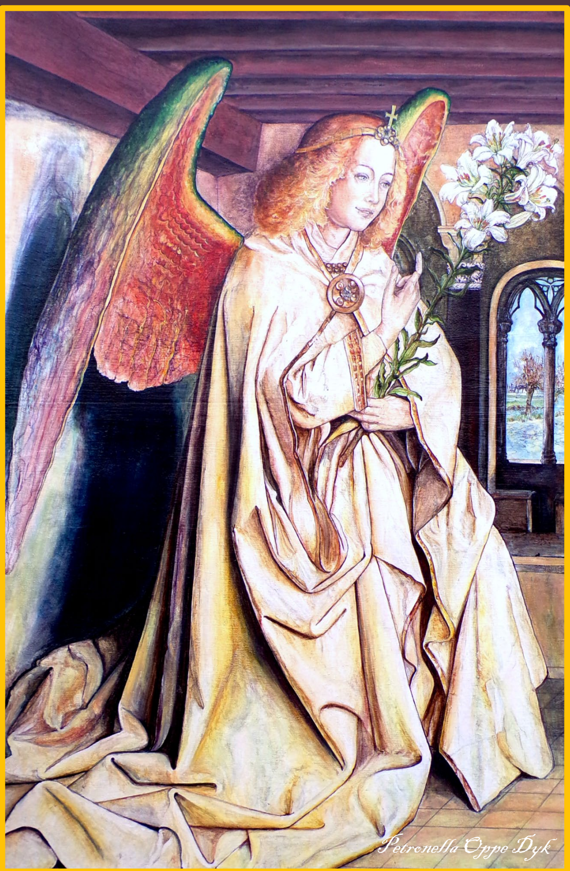
L'Archange Gabriel annonce la naissance de Jésus®