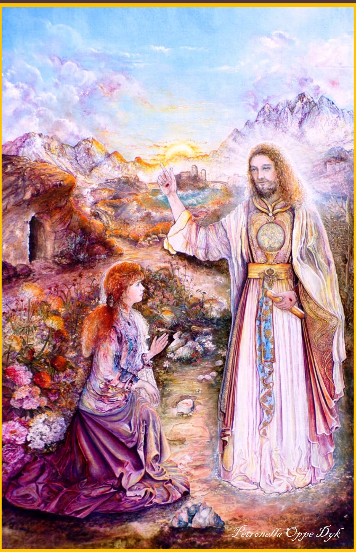
“Noli Me Tangere” ®