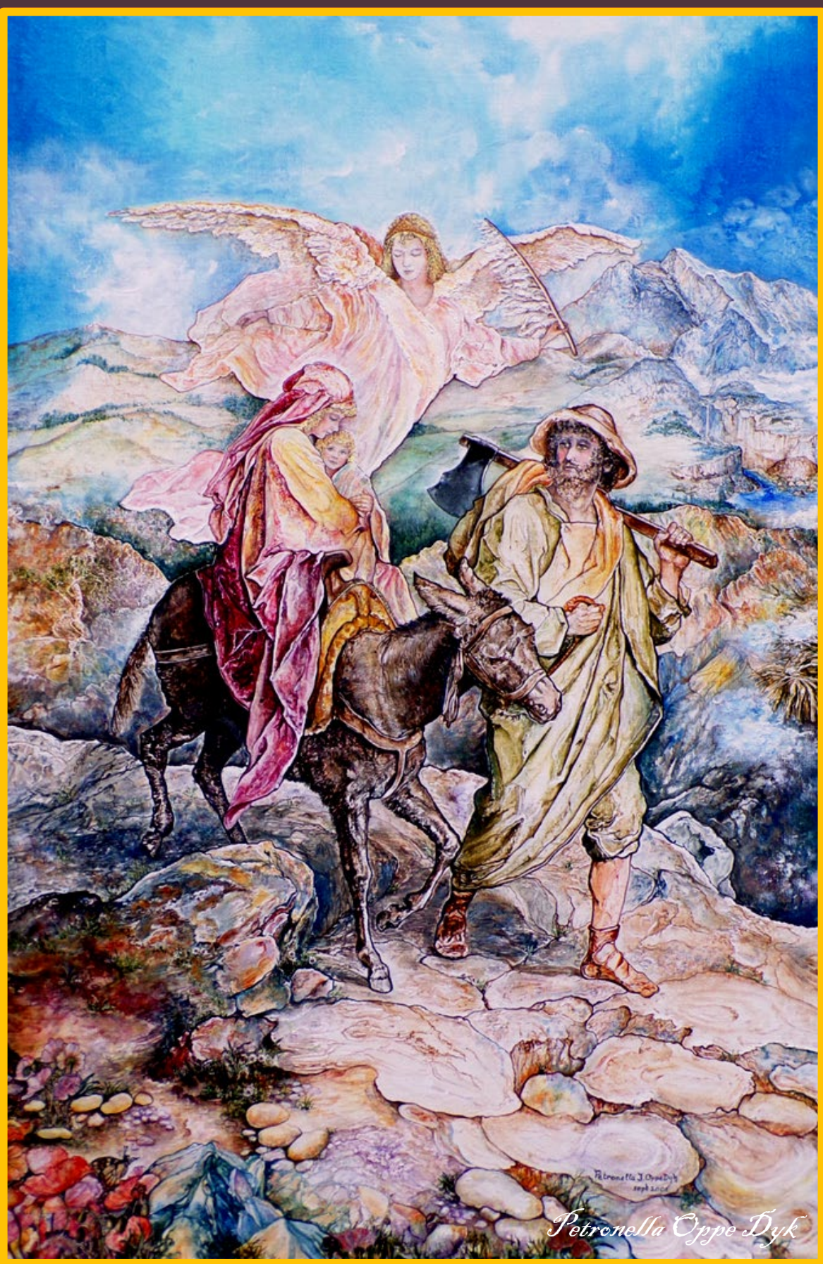
Marie, l'enfant Jésus et Joseph sur le chemin de l'Égypte®